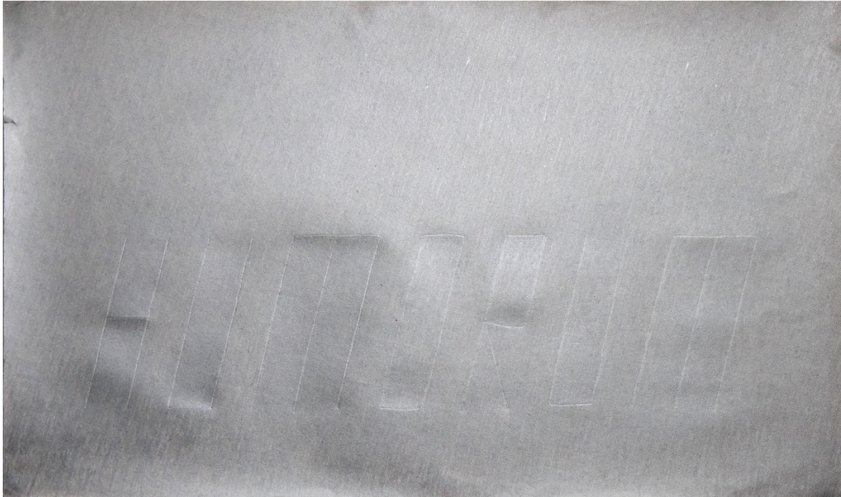
Afbeelding 1: 'HUMDRUM (Negative Aesthetics)' (2024), 32x50cm, papier en potlood.

https://www.eefschoolmeesters.nl/humdrum