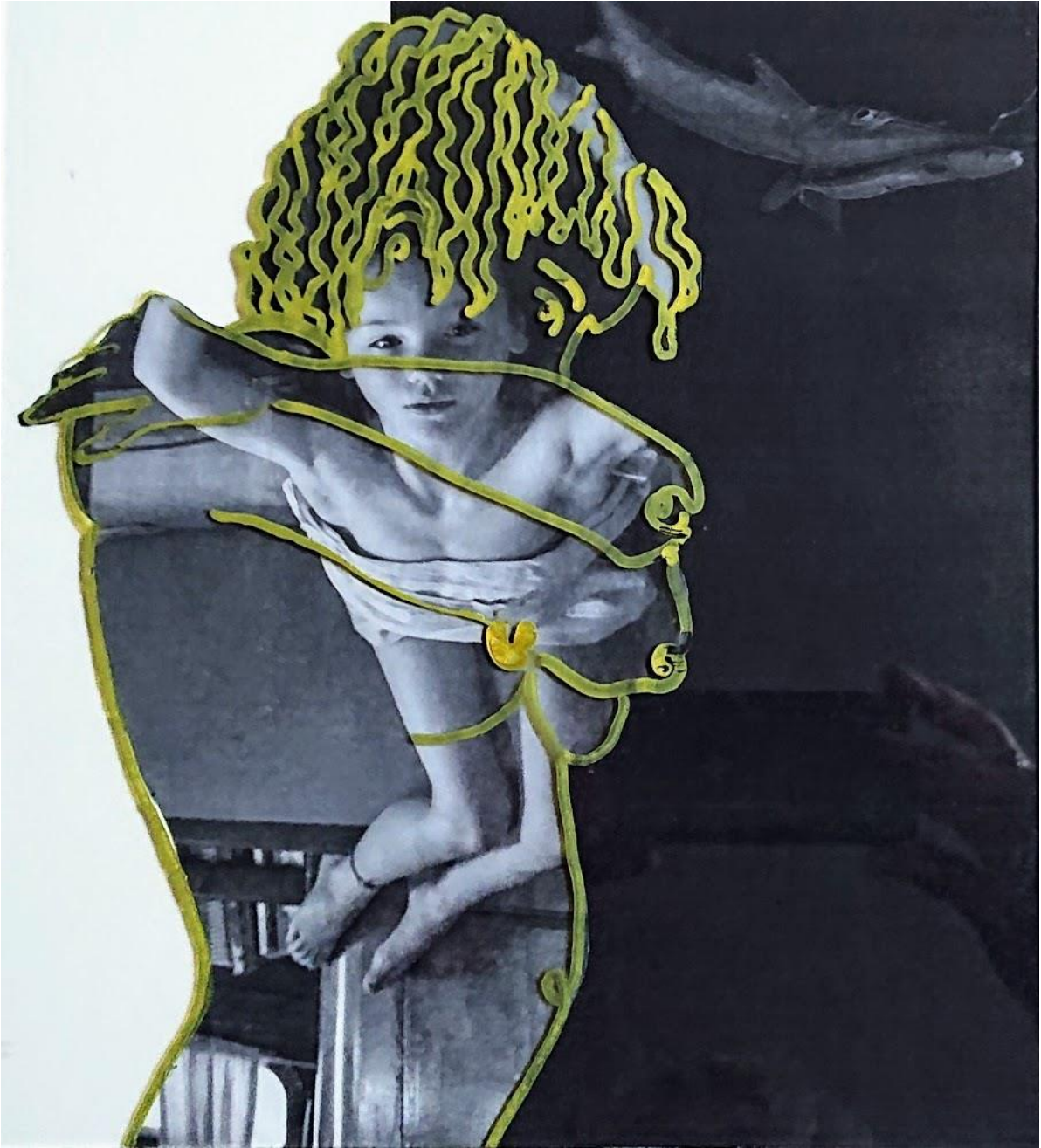
Met enkele zijsprongen die minder mijn ding waren: